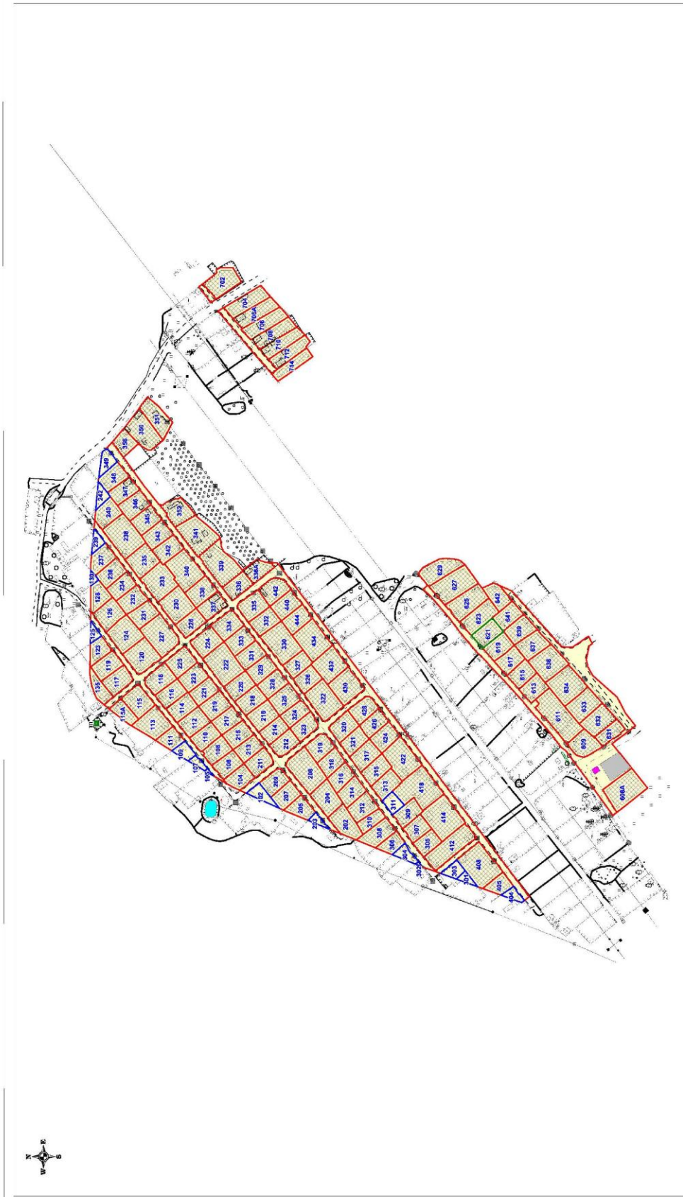
"Экспозиция земельных участков в границах СНТ 'Приозорье'" Приложение №1